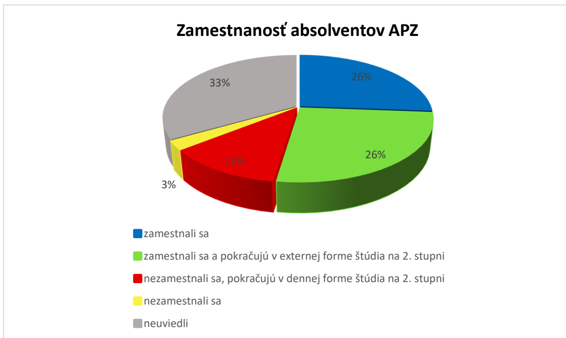
Graf č. 2: Zamestnanosť absolventov APZ v súlade s vyštudovaným odborom